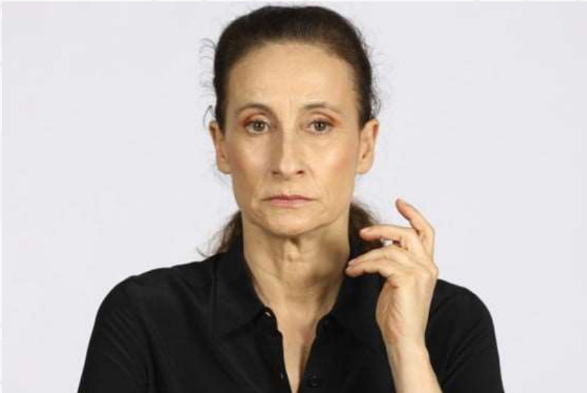
La Persona Deprimida