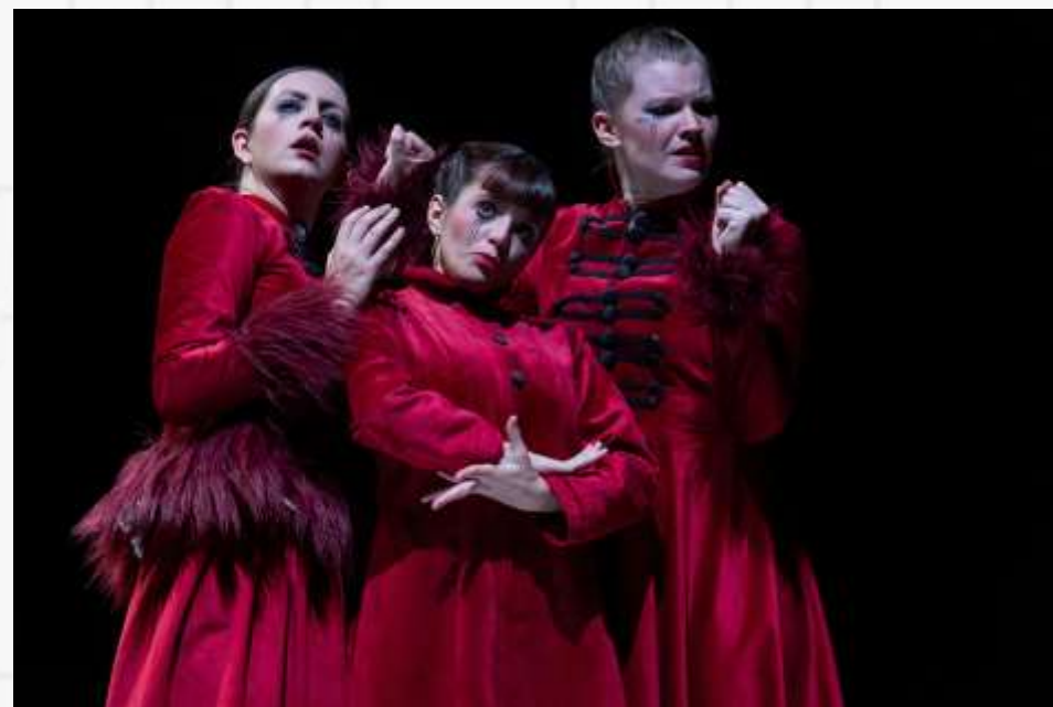
LA TERCERA HERMANA