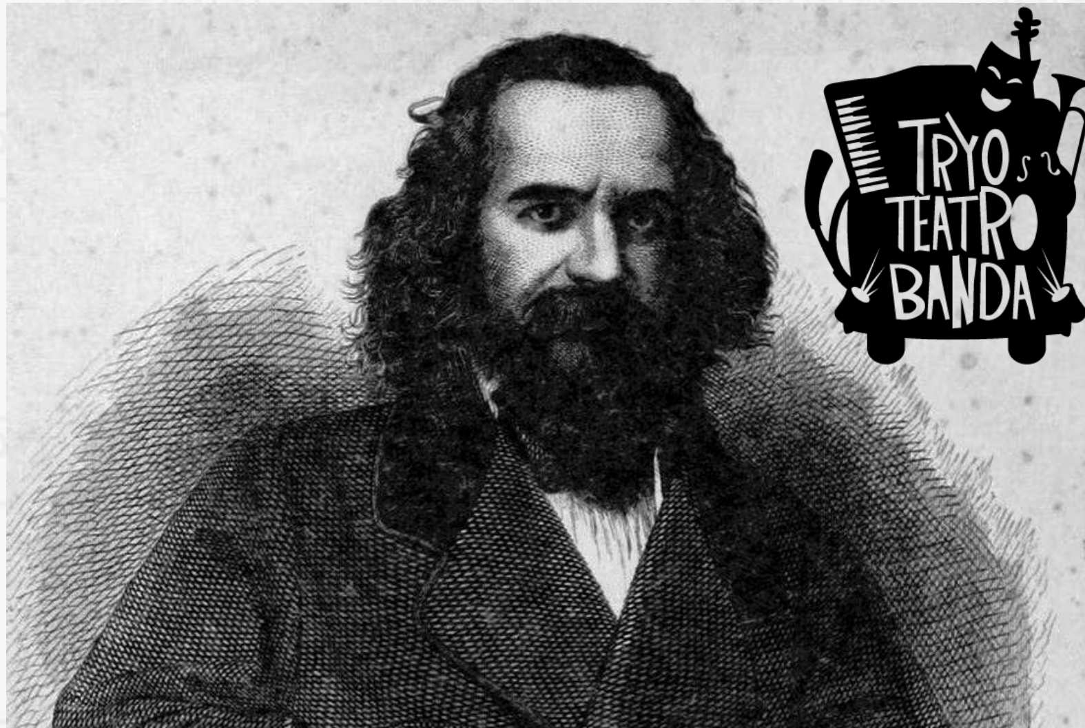
Orélie: el Rey de la Araucanía