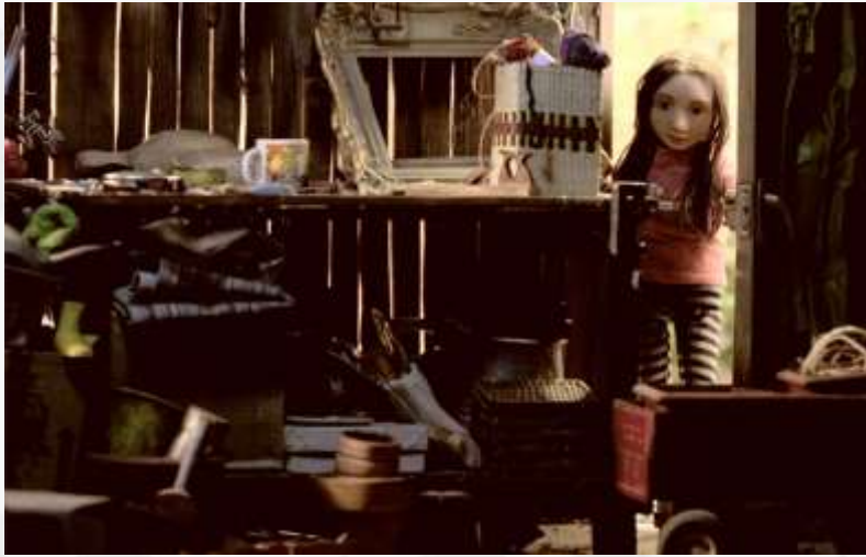
SOBRE LA CUERDA FLOJA