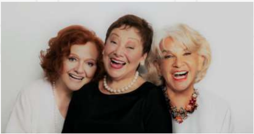
Viejas de Mierda