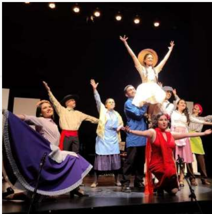
La Pérgola de las Flores