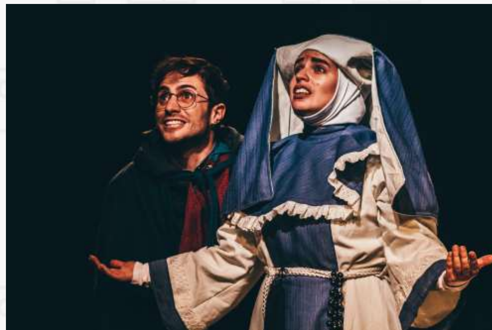
CADÁVER DE DIOS