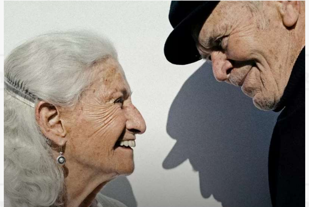
HISTORIA DE AMOR PARA UN ALMA VIEJA