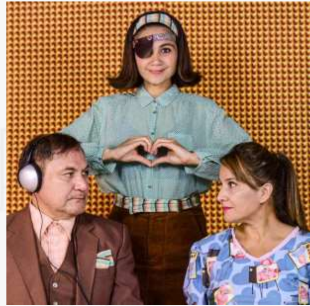
Una comedia super triste