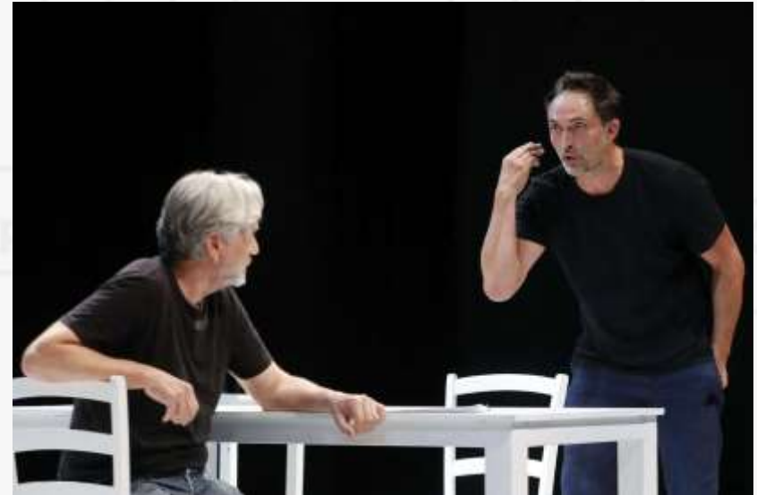
Encuentros breves con hombres repulsivos